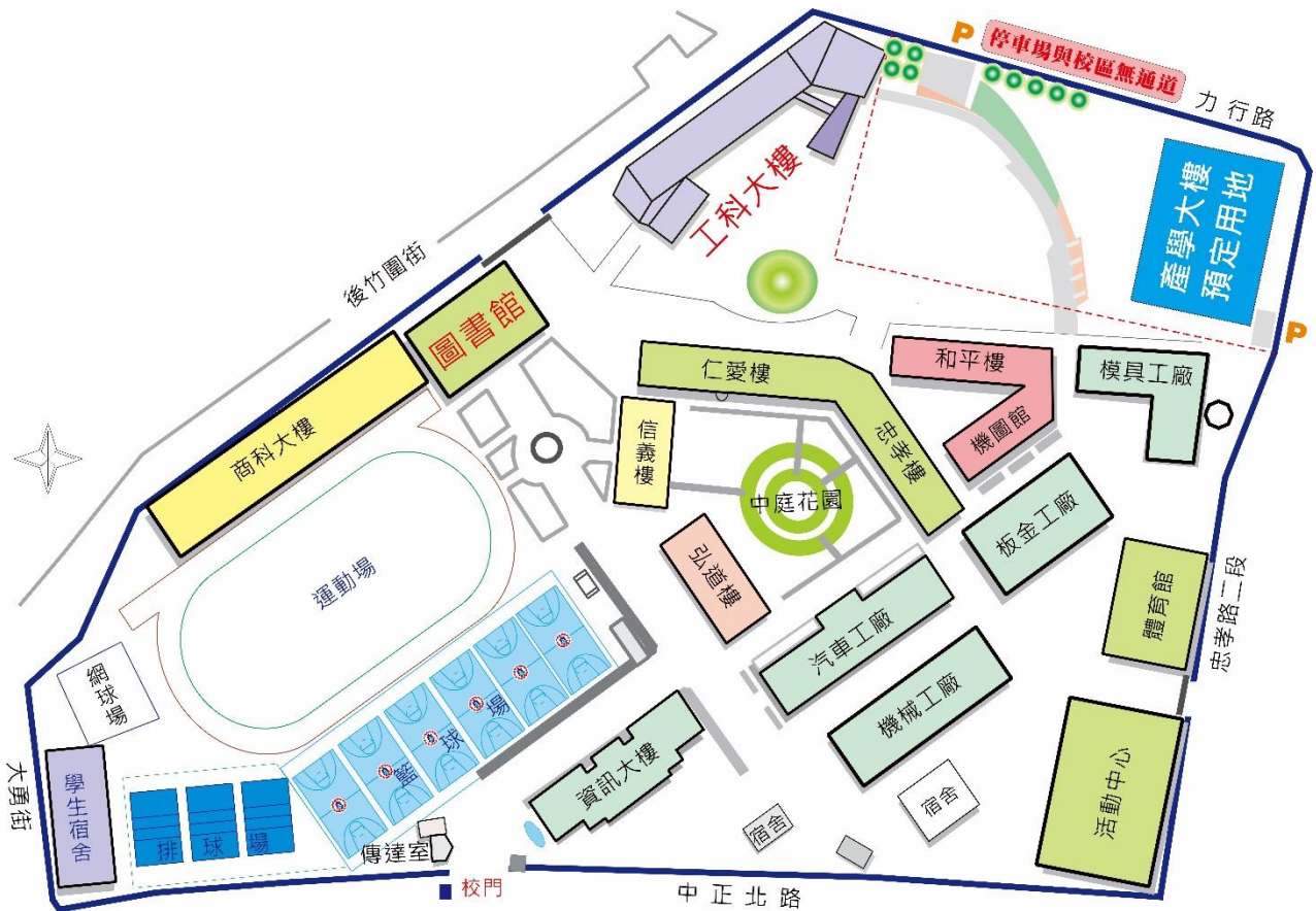
新北市立三重高級商工業職業學校 109 學年度校園配置平面圖